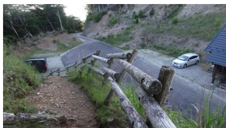
四天石をバックに