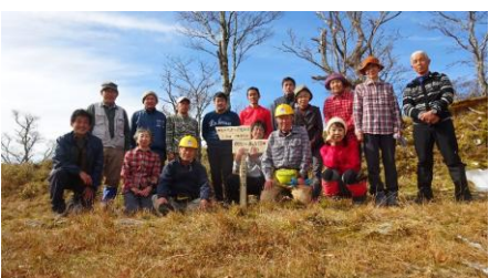
深仙宿に標識設置