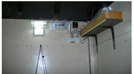
タイマー取り付け