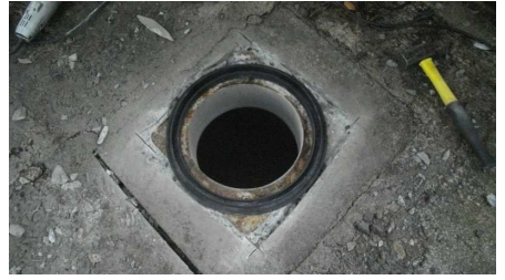
新しい枠を合わせる