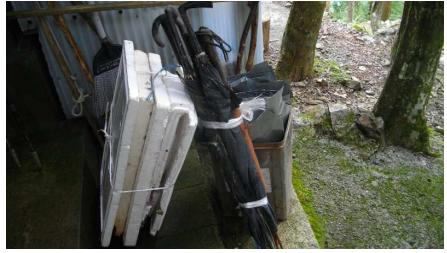
不用品ゴミいろいろ