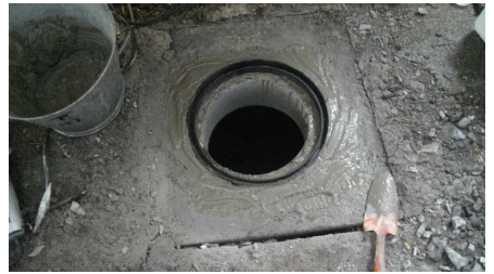
モルタルで固める